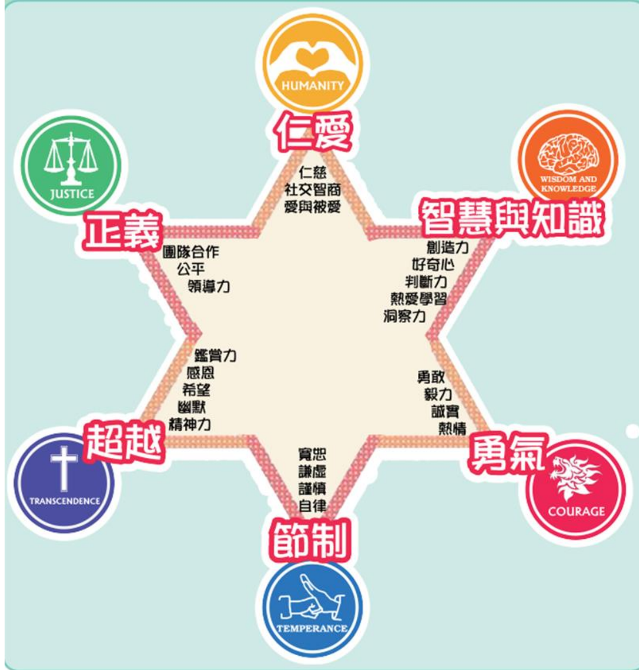
東華三院何玉清教育心理服務中心 (2013) 「正向工程-中學生正向心理教育課程」